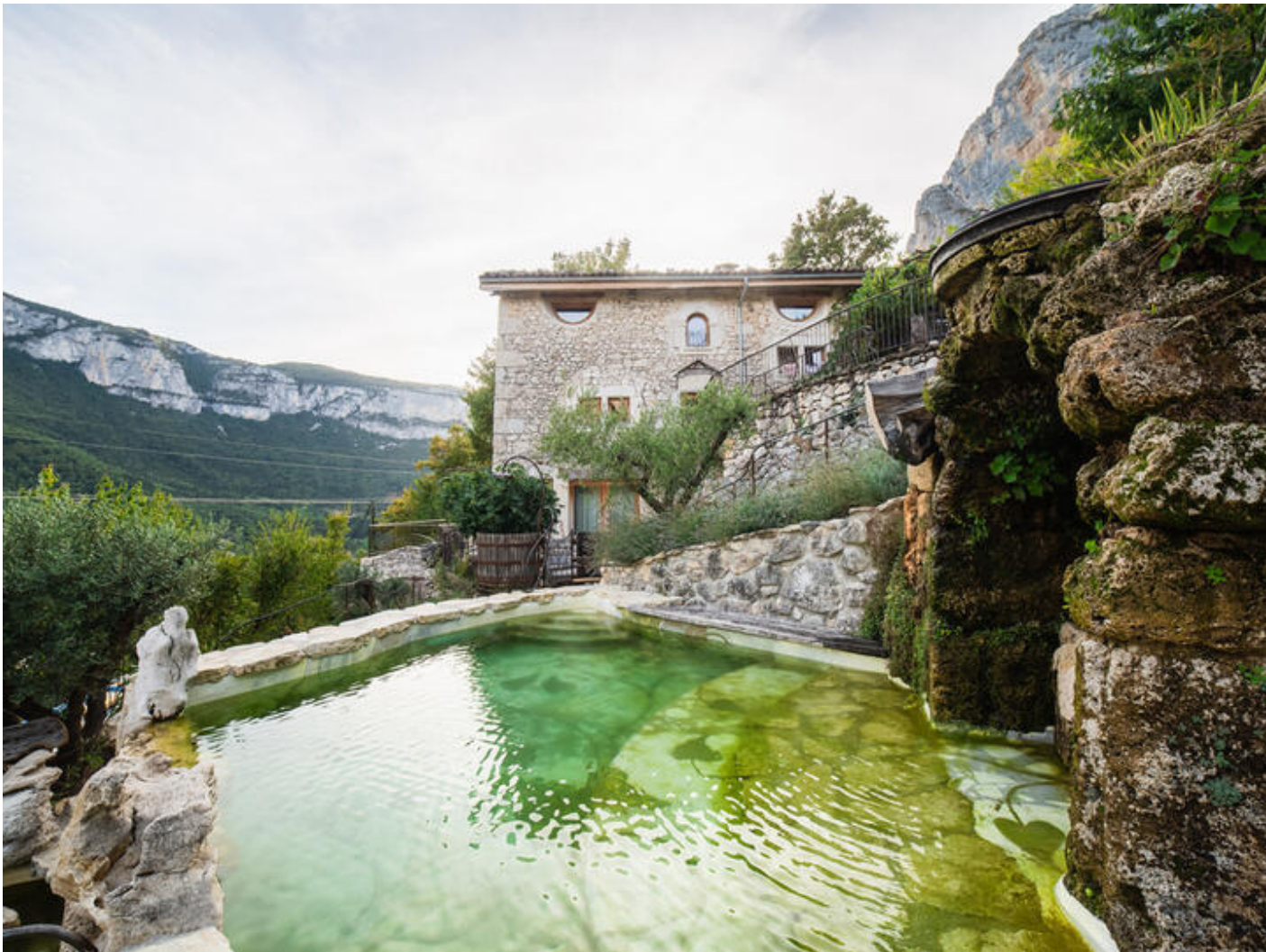
Gîtes Les Hauts de Choranche 38680 Choranche