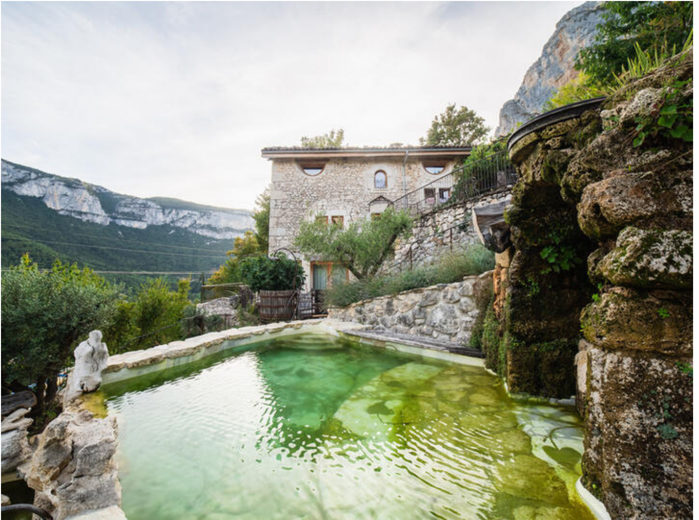
Gîtes Les Hauts de Choranche 38680 Choranche