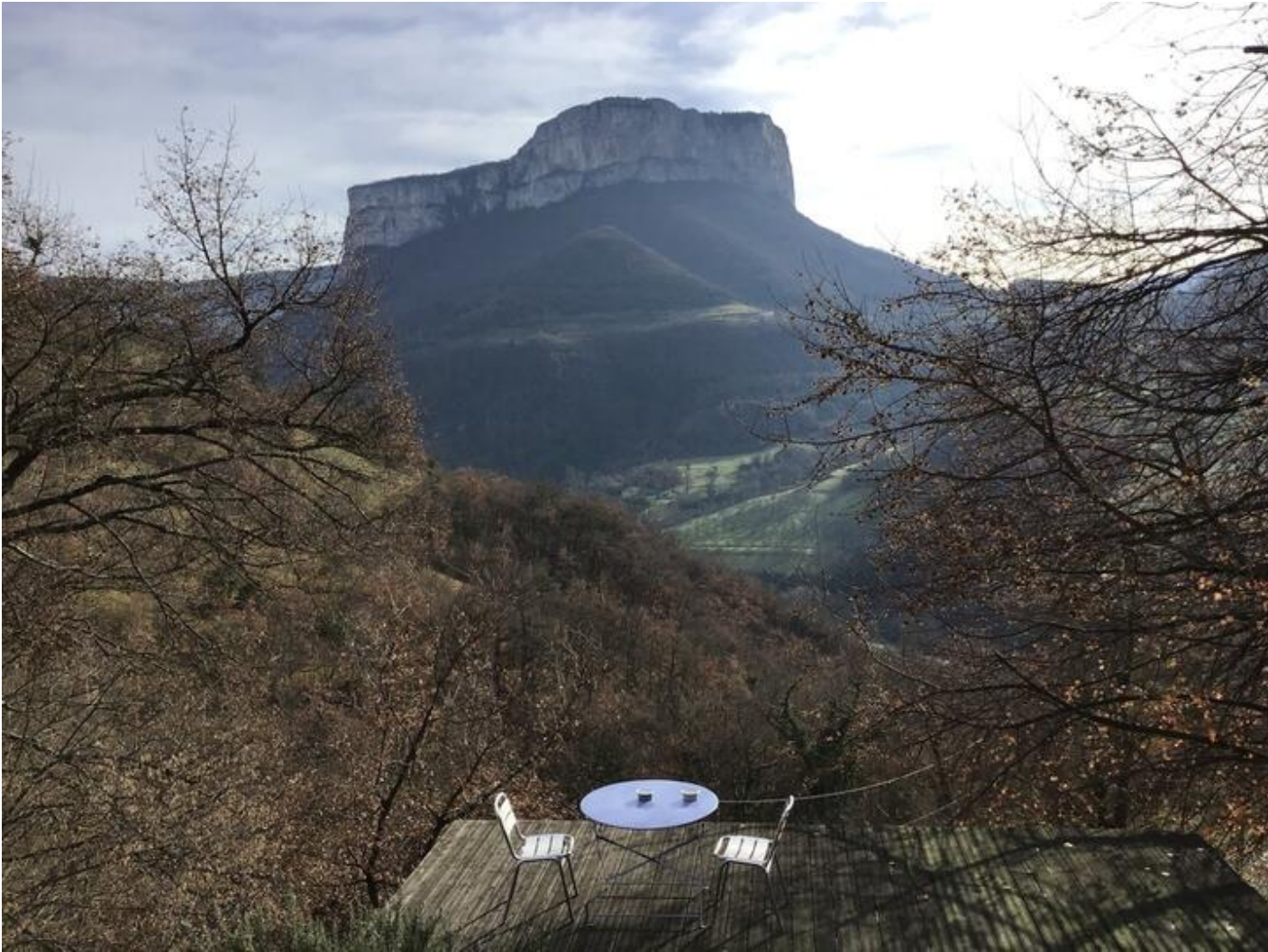
Studio en pleine nature 38680 Choranche