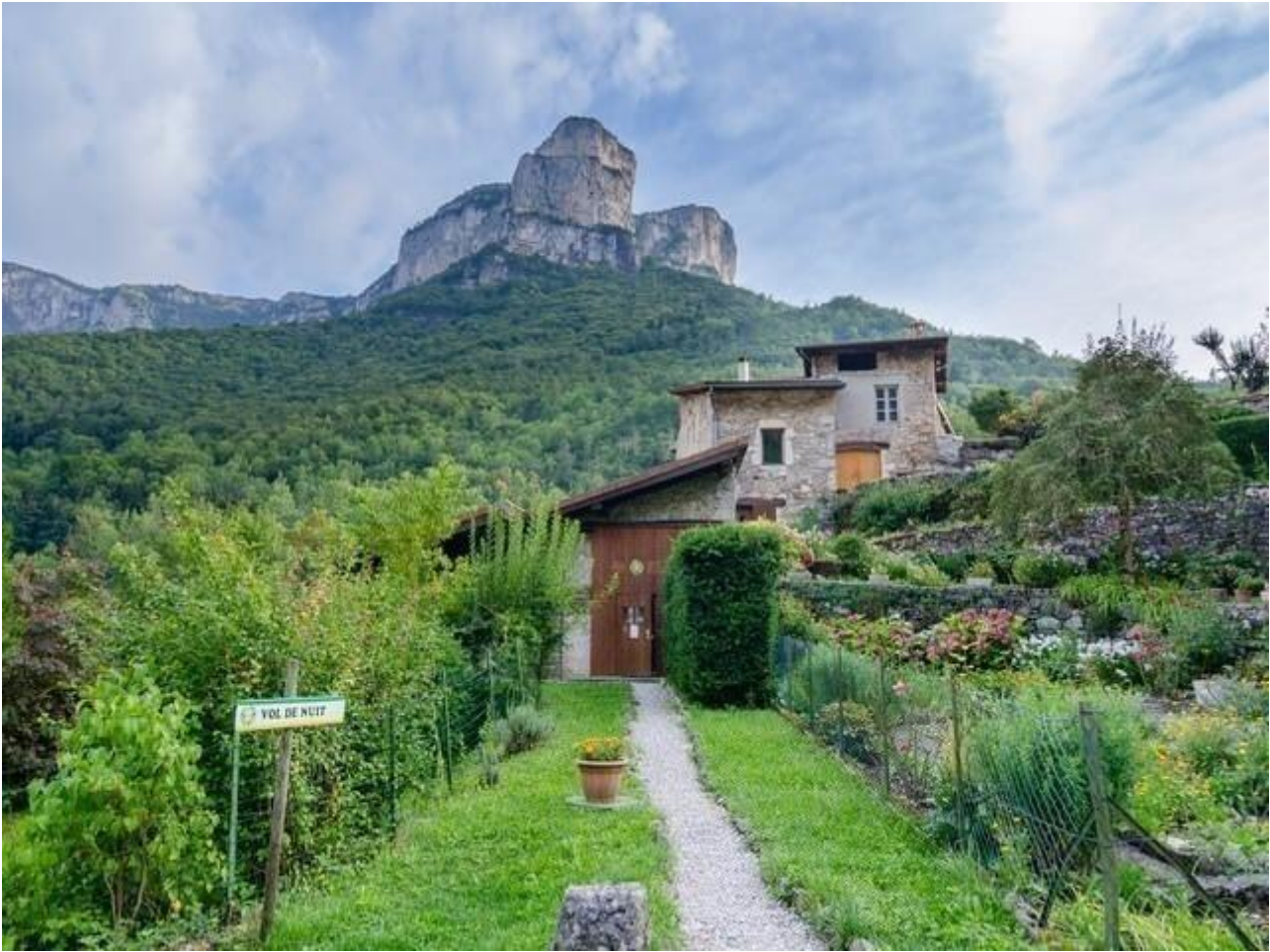
Vol de nuit 38680 Choranche